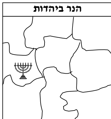
דוגמא ללוח פאזל